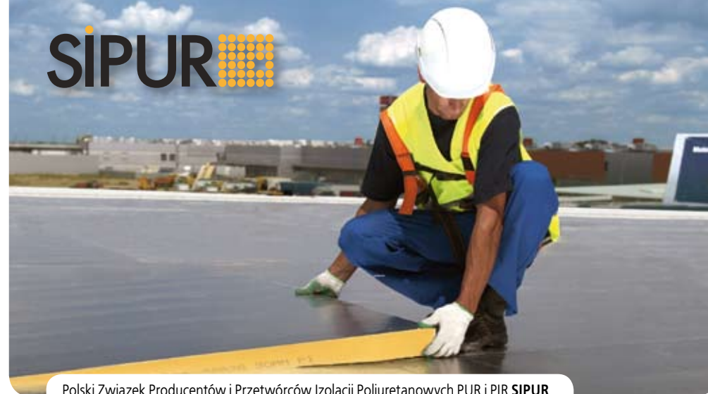
Polski Związek Producentów i Przetwórców Izolacji Poliuretanowych PUR i PIR SIPUR