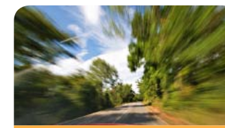
ZMNIEJSZENIE EMISJI CO 2